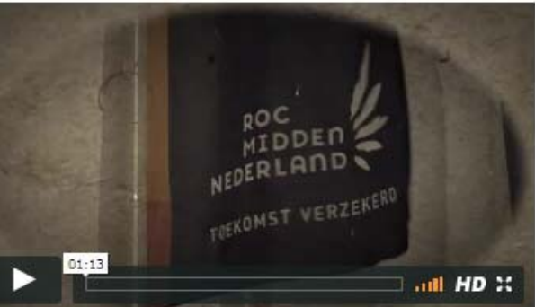
Excellentieprogramma's ROC Midden Nederland