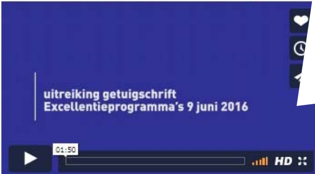
Wat levert een excellentieprogramma je op